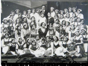
Снимка от 1946 г. на Директорския кабинет на общинския съвет в село „Велико