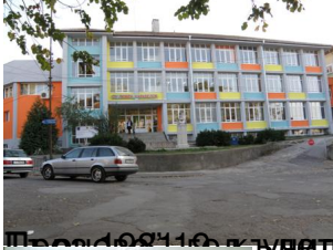
През 1994 г. в село Великото се правят две новопостроената сграда на улица „Велико