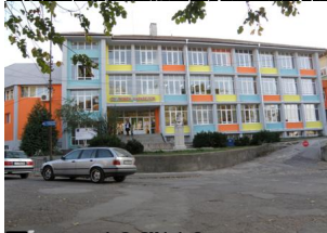
През 1974 г. в детско топлоцентрално здание е поновостроената сграда на улица „Велико